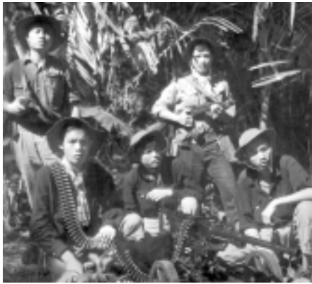
Det var unge mænd som disse som lægen Dang Thùỳ Trâm behandlede når de blev sårede.